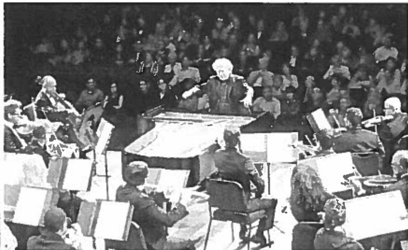
La interacción de la OSPH con el director invitado, el maestro Jeffrey Kahane, produjo una velada mágica llena de virtuosismo.