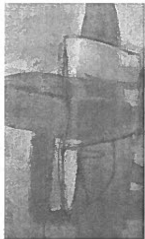
"Trans" pieza que también forma parte de la exhibición "Portal".

Existen varios elementos nuevos que refrescan la iconografía y lenguaje plástico del artista en este trabajo. "Quizás el hecho de que mi estudio esté localizado en nuestras sinuosas montañas y con increíble vista del Lago Carrizal es en parte lo que se ha